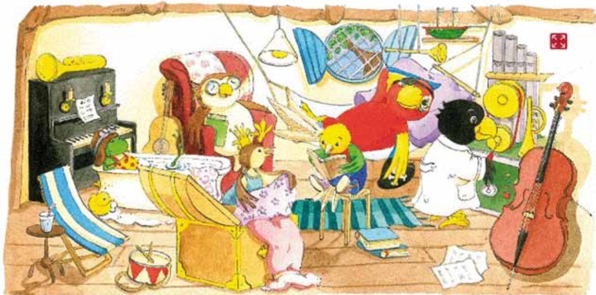
Mehr unter http://die-carusos.de

Kath. Kindergarten St. Walburga Gundelsheim-Bachenau 20 Kinder, 1 Gruppe, Leitung Sylvia Lauch